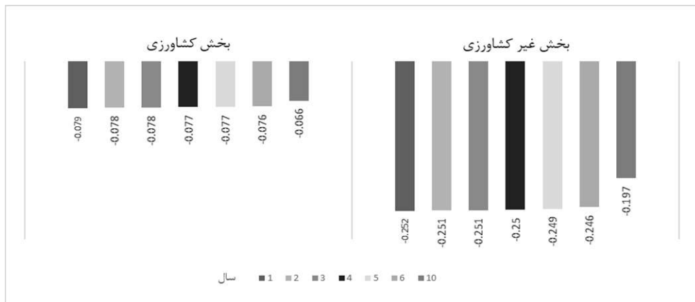
نمودار ۲- تأثیر بخش کشاورزی و غیرکشاورزی بر تغییر نرخ وابستگی به واردات طی هفت سناریو حذف یارانه نان (درصد).